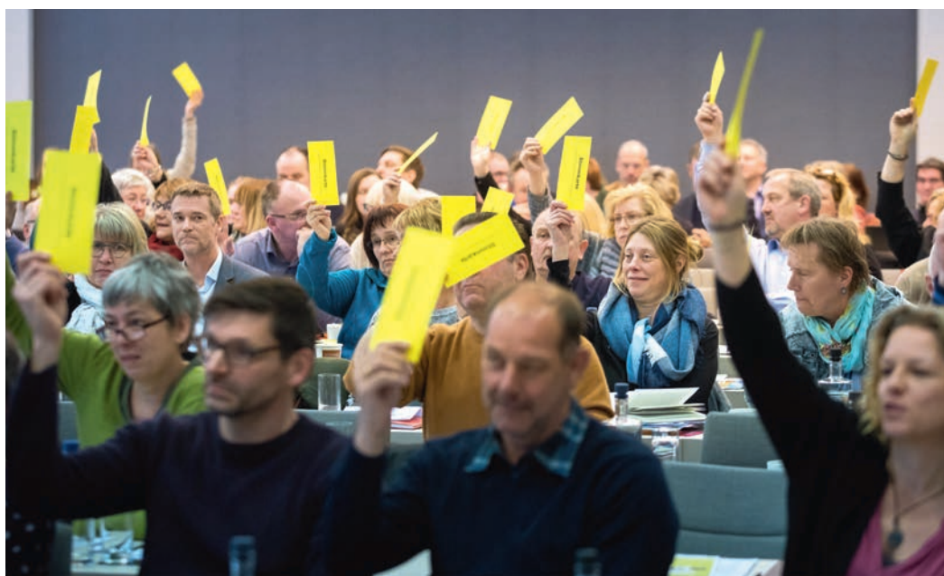
Mehr Geld muss her: Abstimmung der ver.di-Bundestarifkommission in Berlin

Schon seit 2015 nehmen Bund, Länder und Kommunen insgesamt mehr ein, als sie ausgeben.